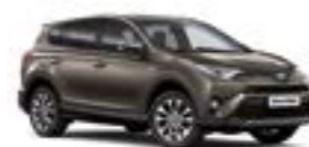
4T3 Бронзовий 5