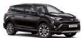
209 Чорний 5