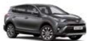
163 Сірий 5