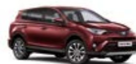
3T0 Темно-червоний 5