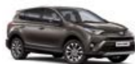
4U5 Темно-коричневий 5

Вся інформація, представлена у цьому матеріалі, є точною та дійсною станом на дату публікації 19.10.2016. Імпортер автомобілів Toyota залишає за собою право вносити зміни до інформації, наведеної в цьому матеріалі, без попереднього повідомлення.