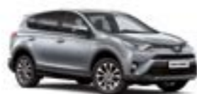
1D6 Сріблястий 5