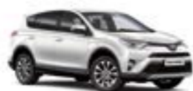
070 Білий перламутр 5