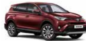
3T0 Темно-червоний 2