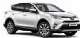
070 Білий перламутр 2