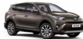
4T3 Бронзовий 2