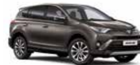
4U5 Темно-коричневий 2