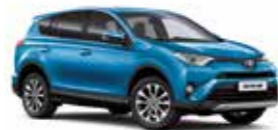
8X7 Блакитний 2

1 Ці дані отримано в ідеальних умовах без урахування манери водіння, дорожніх, погодних та інших умов, які впливають на витрату пального. Реальна витрата пального може відрізнятися від зазначеної і визначається лише експериментальним шляхом.