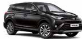
209 Чорний 2