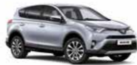
1F7 Сріблястий 2