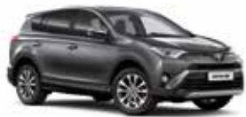
1G3 Сірий 2