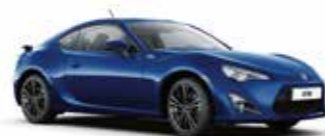
K3X Темно-синій 5

Вся інформація, представлена у цьому матеріалі, є точною та дійсною станом на дату публікації 15.03.2016. Імпортер автомобілів Toyota залишає за собою право вносити зміни до інформації, наведеної в цьому матеріалі, без попереднього повідомлення. Зовнішній вигляд автомобіля та його складових може відрізнятися від зображених у цьому матеріалі. Жодну частину цього матеріалу не може бути відтворено у будь-який спосіб без попереднього письмового дозволу правовласника.