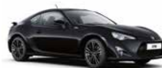
D4S Чорний 5