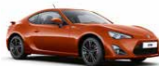
H8R Помаранчевий 5