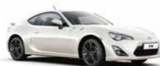
K1X Білий перламутр 5