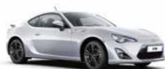
G1U Сріблястий 5