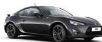
61K Темно-сірий 5