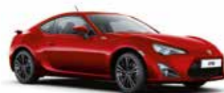
M7Y Червоний 5